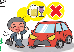
飲酒運転は絶対ダメ！

飲酒運転やあおり運転（妨害運転）は極めて悪質で危険な犯罪です。アルコールは少量の摂取でも安全運転に必要な情報処理能力、注意力、判断力などを低下させ、交通事故の危険を高めます。お酒を飲んだら絶対に車を運転してはいけません。あおり運転もやめましょう。