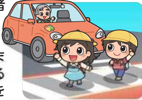
横断歩道は歩行者優先

横断歩道は歩行者優先です。運転者には横断歩道手前での減速義務や停止義務があります。歩行者の横断を妨げないようにしましょう。歩行者や他の車両に対する「思いやり・ゆずり合い」の気持ちを持って運転しましょう。